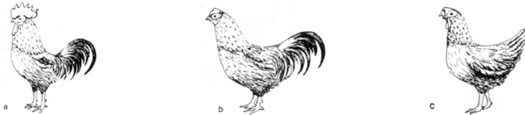
Afbeelding 1.1 a: haan, b: gecastreerde haan, c: hen

Sinds prehistorische tijden weet men dat gecastreerde huisdieren grote verschillen vertonen ten opzichte van normale soortgenoten. De gecastreerde stier wordt een makke os en wordt sneller vet. Een gecastreerd haantje (een kapoen) heeft later kleine kammen, lellen en oorlapjes, hij kraait niet en van zijn vechtlust is ook niets te merken (afb. 1.1).