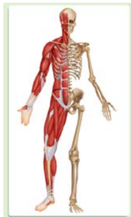
Afbeelding 1.2 Skelet en spieren 7

Het actieve bewegingsapparaat bestaat uit alle spieren in je lichaam. Dit actieve deel zorgt voor de bewegelijkheid en de stabiliteit van je lichaam. Voor een juiste balans is samenwerking tussen spieren en gewrichten, in nauwe samenwerking met het zenuwstelsel en het brein van belang.